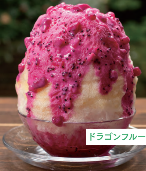
ドラゴンフルーツのミルク氷 1,499円